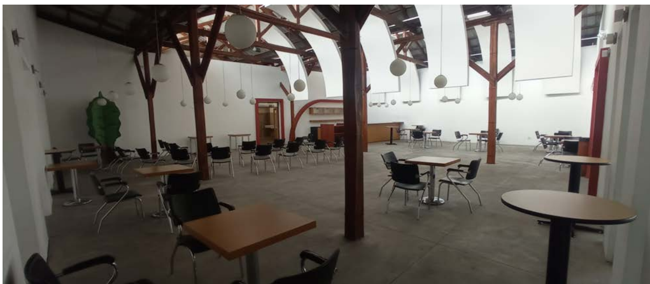
Imagen 1. Cafetería MIC.

La “Cafetería del MIC”, se encuentra ubicada dentro del edificio del Museo Interactivo de Ciencia, al lado sur oriental, sector de Plaza Tulipe.