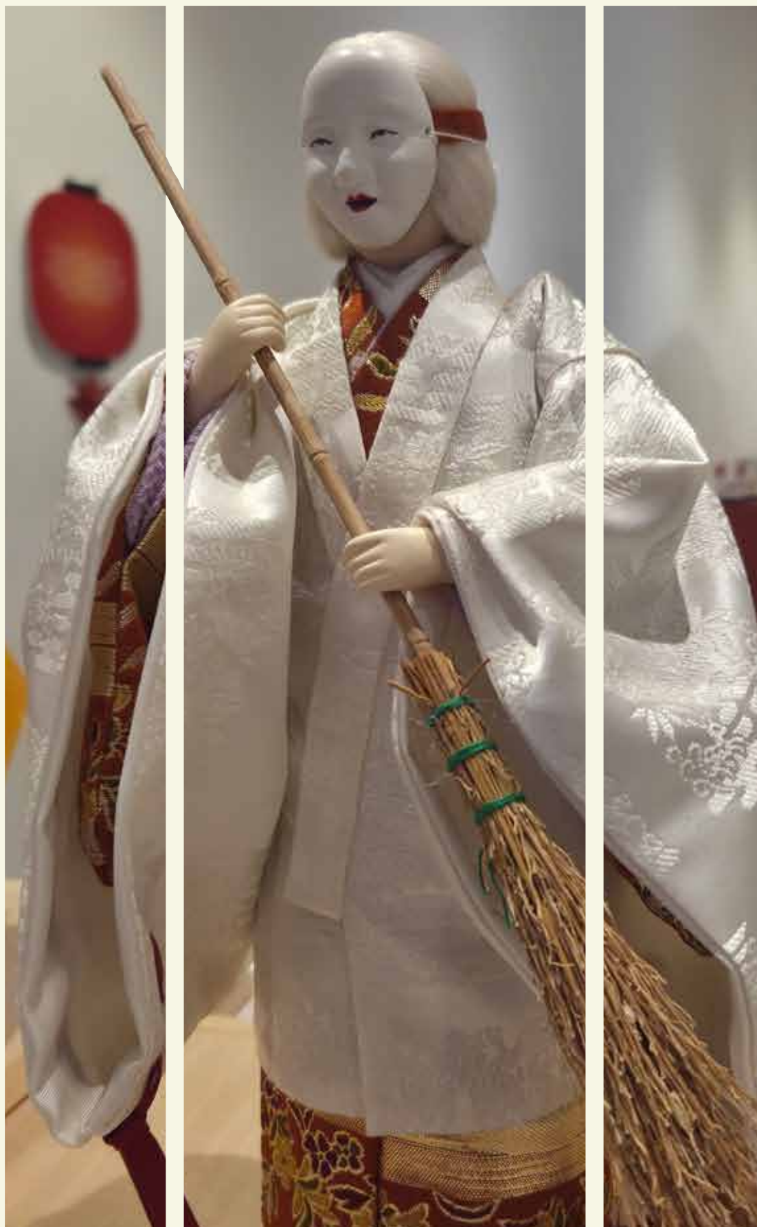
Ningyō / Museo de La Ciudad