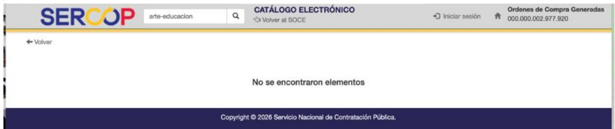
Captura de pantalla producto 3.1